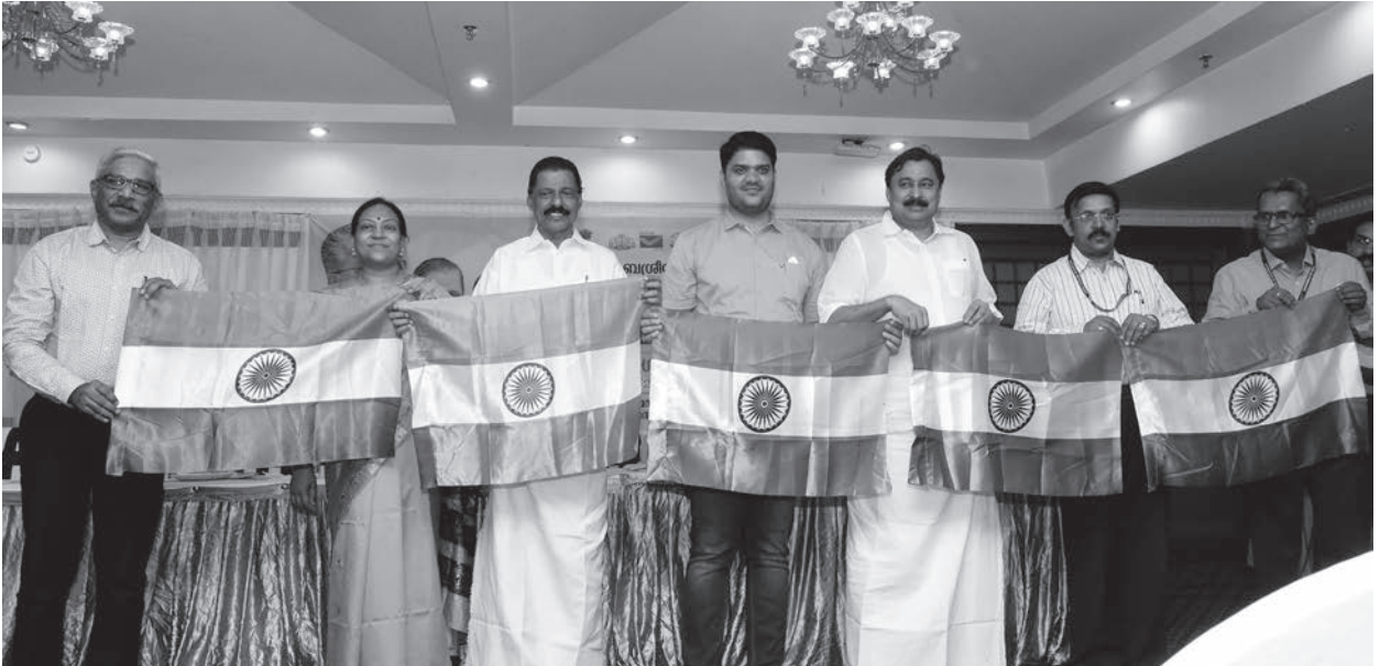
ഹർ ഘർ തിരംഗ് യുടെ ഭാഗമായി ദേശീയ പതാക ഏറ്റു വാങ്ങി മന്ത്രിമാരായ എം.വി ഗോവിന്ദൻ മാസ്റ്ററും വി.അബ്ദു റഹ്മാനും.