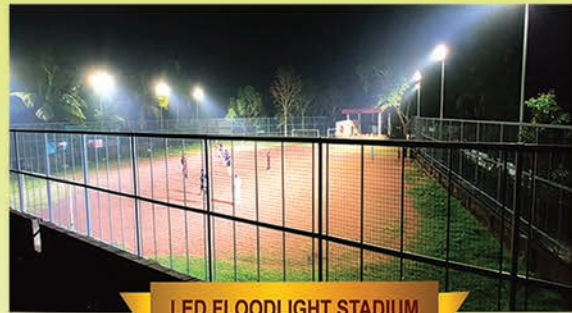
LED FLOODLIGHT STADIUM