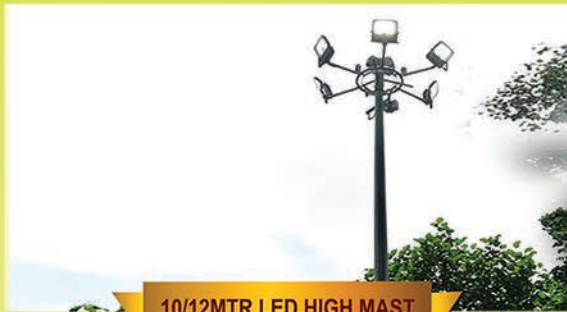
10/12MTR LED HIGH MAST