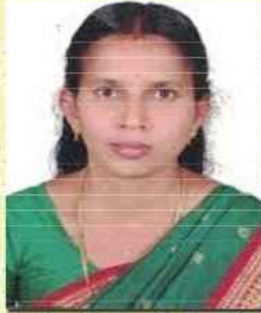
ചെയർപേഴ്സൺ ജി.പി. വി