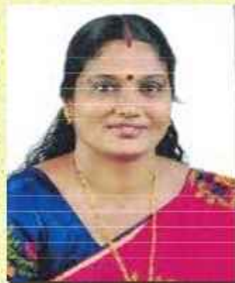
ലത. കെ. എം