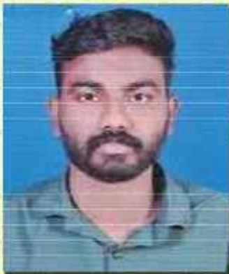
ശരത്. എം. കെ