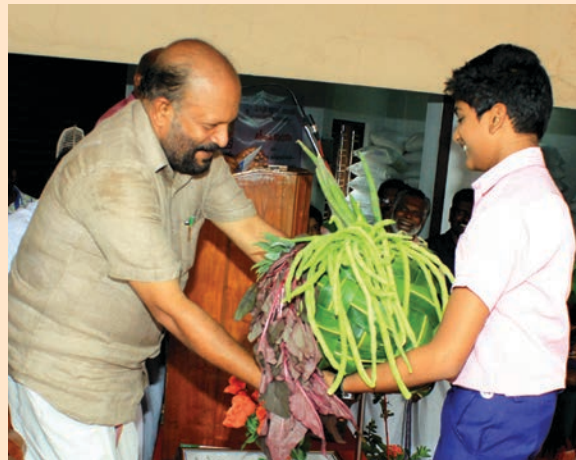
കൃഷിവകുപ്പ് മന്ത്രിക്ക് കരുണിന്റെ ഹരിത സമ്മാനം.

ഗ്രാമപഞ്ചായത്തുകൾ അനുവദിച്ച സ്ഥലങ്ങളിലാണ് വിപണികൾ പ്രവർത്തിക്കുന്നത്. കെട്ടിട സൗകര്യം വേണ്ടവയ്ക്ക് ബ്ലോക്ക് പഞ്ചായത്ത് കെട്ടിടം നിർമ്മിച്ചു നൽകുന്നു. അടിസ്ഥാനാവശ്യങ്ങളായ ത്രാസുകൾ, ഫർണിച്ചറുകൾ, ലേലം നടത്തുന്നതിന് സഹായകമായ മൈക്ക് സെറ്റ് തുടങ്ങിയവ ആദ്യഘട്ടമായി നൽകി.