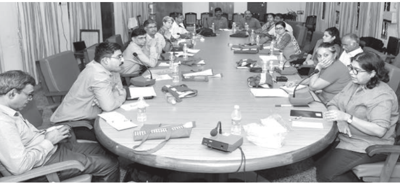
ലോഗിൻ ഏഷ്യയുടെ ഇന്ത്യാ പ്ലാറ്റ്ഫോമിന്റെ ദ്വിദിന ദേശീയ ശില്പശാല