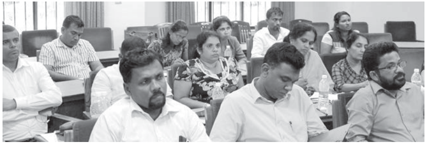
പ്രാദേശികാനുഗ്രഹത്തെക്കുറിച്ച് പഠിക്കുന്നതിനു കിലയിലെത്തിയ ശ്രീലങ്കൻ ഉദ്യോഗസ്ഥസംഘം

കേരളത്തിലെ അധികാരവികേന്ദ്രീകരണത്തെക്കുറിച്ചും പ്രാദേശികാനുഗ്രഹത്തെക്കുറിച്ചും പഠിക്കുന്നതിനു ശ്രീലങ്കയിലെ തദ്ദേശഭരണസ്ഥാപനങ്ങളിൽ നിന്നുള്ള ഉദ്യോഗസ്ഥസംഘം കിലയിലെത്തി. ശ്രീലങ്കയിൽ പ്രവർത്തിക്കുന്ന ഏഷ്യ ഫൗണ്ടേഷന്റെ നേതൃത്വത്തിലുള്ള ഇരുപതംഗ സംഘത്തിൽ 11 പേർ വനിതകളായിരുന്നു. ഒമ്പതു പ്രോവിൻസുകളിലെ തദ്ദേശസ്ഥാപനങ്ങളിൽനിന്നുള്ളവരാണ്. അഞ്ചുദിവസം നീണ്ട സന്ദർശനപരിപാടിക്കിടയിൽ വിവിധ വിഷയങ്ങളിൽ ഇവർക്കു പരിശീലനവും ഏർപ്പെടുത്തിയിരുന്നു.