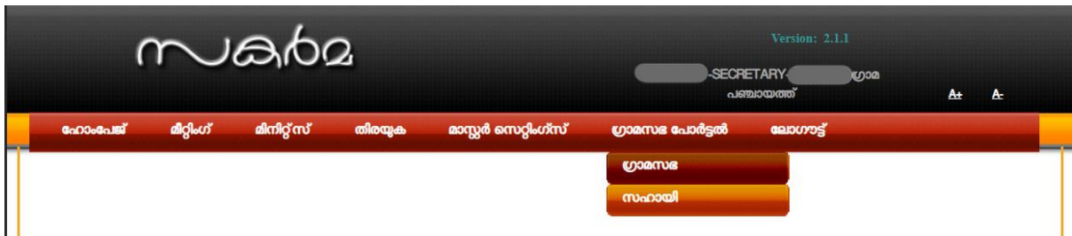
ചിത്രം 1 : ഗ്രാമസഭ

പ്രധാന മെനു >> ഗ്രാമ സഭ പോർട്ടൽ >> ഗ്രാമസഭ.